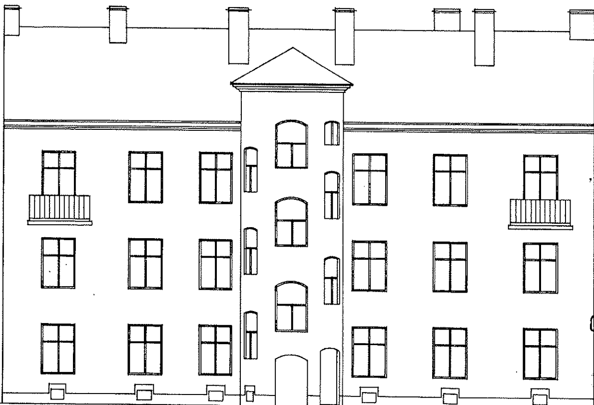
FASAD MOT GÅRDEN.

Byggnadsnämnden Södertälje arkiv SILEN 6.